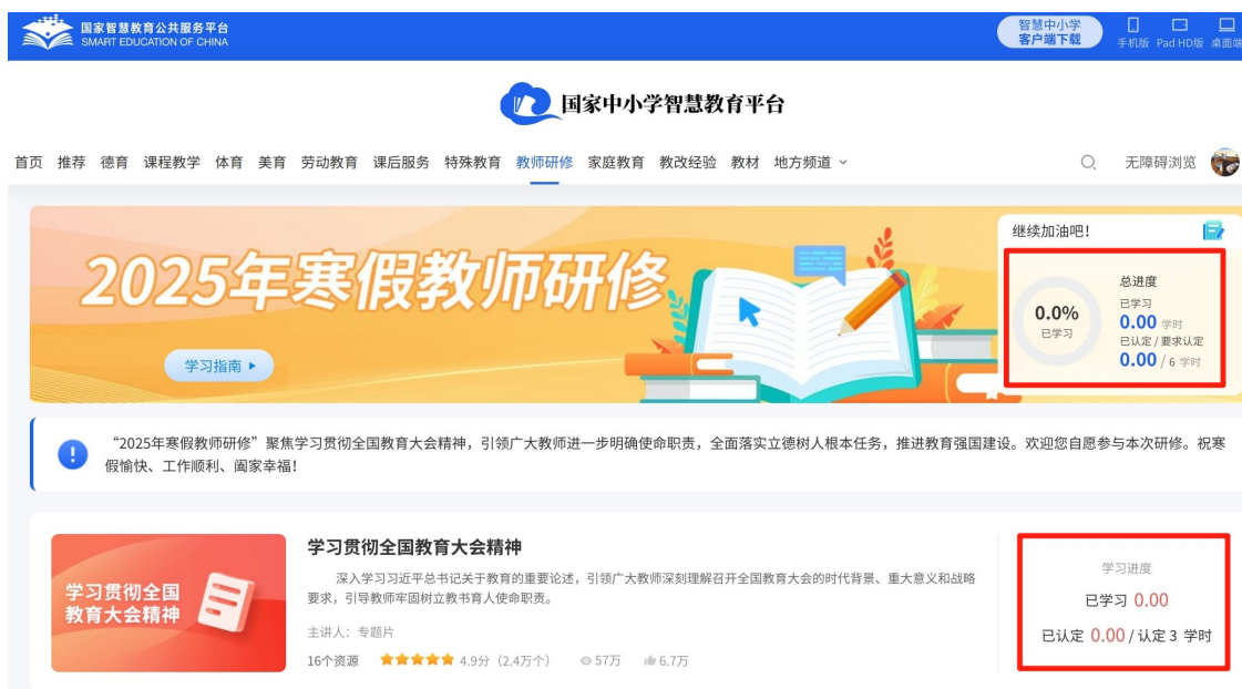
图 11 查看学习进度方式

方式 2： 登录国家中小学智慧教育平台（basic.smartedu.cn），依次点击右上角的头像—“个人中心”—“我的培训”—“专题培训”—“2025 年寒假教师研修”查看。进度的详细含义请参看方式 1。