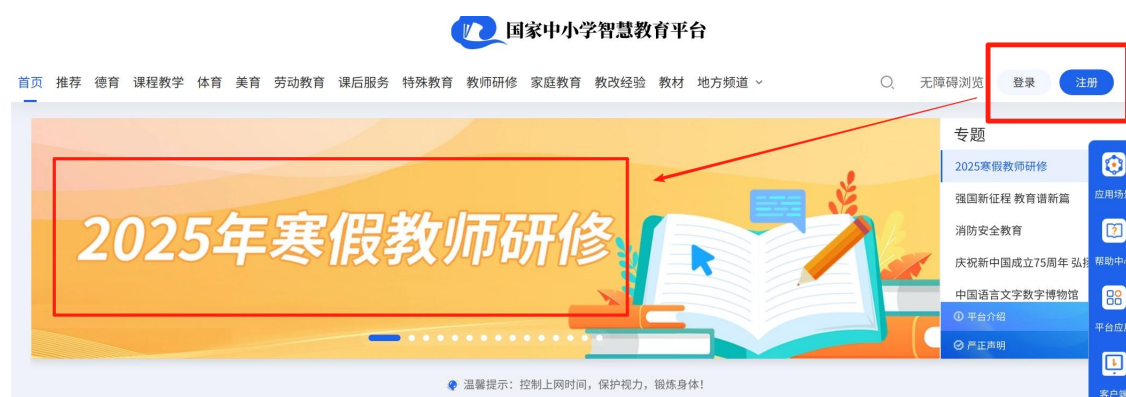
图 1 注册、登录、进入专题页

方式 1：使用网页浏览器，访问国家中小学智慧教育平台（basic.smartedu.cn）。如图 1，点击右上角完成注册（ 请选择教师身份 ）、登录。登录后，点击首页的“2025 年寒假教师研修”轮播图，进入专题页。或在教师研修—国培示范—专题培训栏目中找到“2025 年寒假教师研修”并进入专题页。