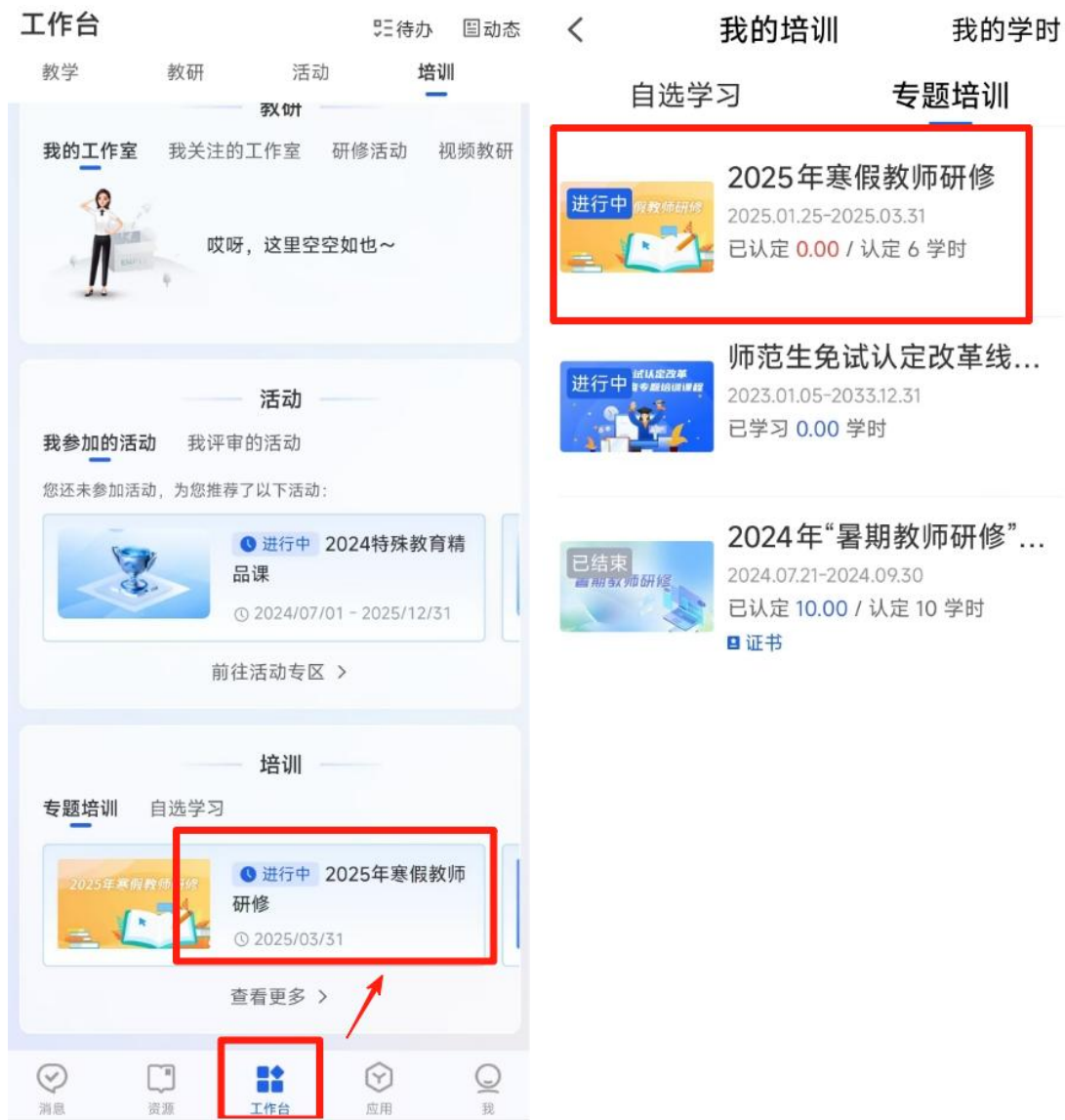
图 9 APP 端从工作台进入学习

方式 5：使用网页浏览器，访问国家智慧教育公共服务平台(www. smartedu. cn)。在页面顶部的轮播图中，点击“2025 年寒假教师研修”进入专题页，再在专题页中选择 基础教育学习入口 进入基础教育学习专题页。