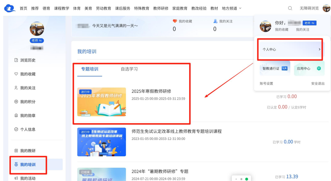
图 8 网页端从个人中心进入学习

问国家中小学智慧教育平台（basic.smartedu.cn），登录后，如图 8 点击右上角头像进入“个人中心”-“我的培训”-“专题培训”-“2025 年寒假教师研修”专题，点击相关课程进行学习。或登录智慧中小学 APP/桌面端，如图 9，在“工作台”中下拉到底，在“培训”中点击“专题培训”下方的“查看更多”进入专题培训页，点击“2025 年寒假教师研修”进入专题页学习。