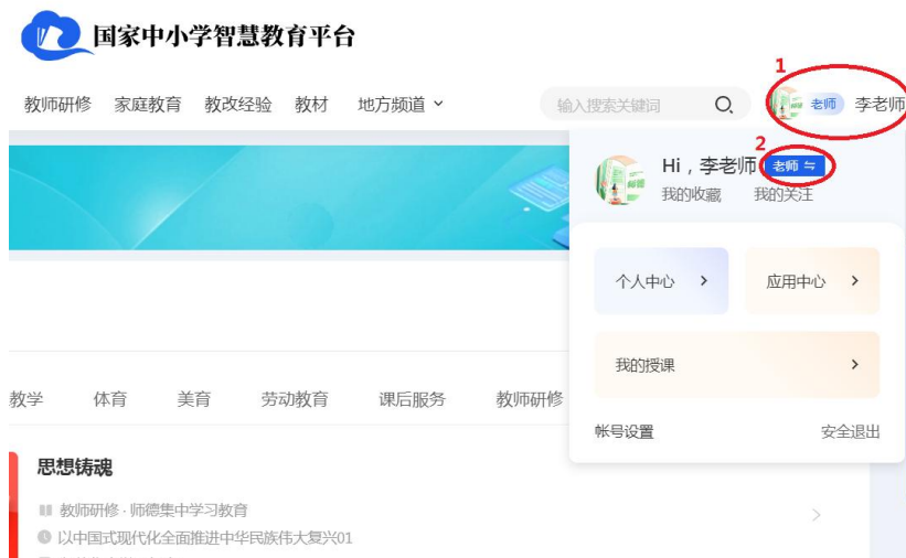
图 16 家长身份切换为教师身份步骤