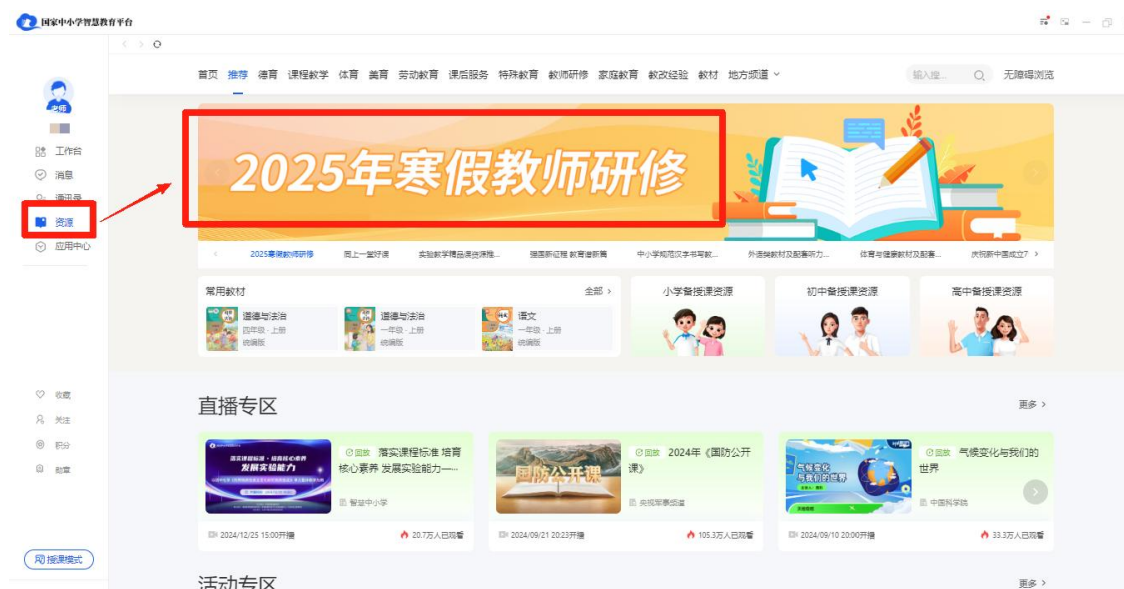
图 7 从桌面端进入专题页

打开软件后，首先进行个人账号登录。登录后，点击桌面端左侧“资源”栏，然后在首页轮播图中点击“2025 年寒假教师研修”进入专题页。点击“立即报名”即可开始学习。