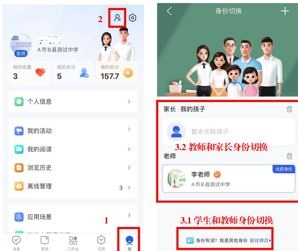
图 15 学生身份修改为教师身份步骤

我，如图 15，点击右上角切换图标进行身份切换。注：学生身份修改为教师身份会清空原学生身份数据。目前平台支持学生使用学生号注册，不是必须使用家长手机号注册，建议学生使用学生号注册。