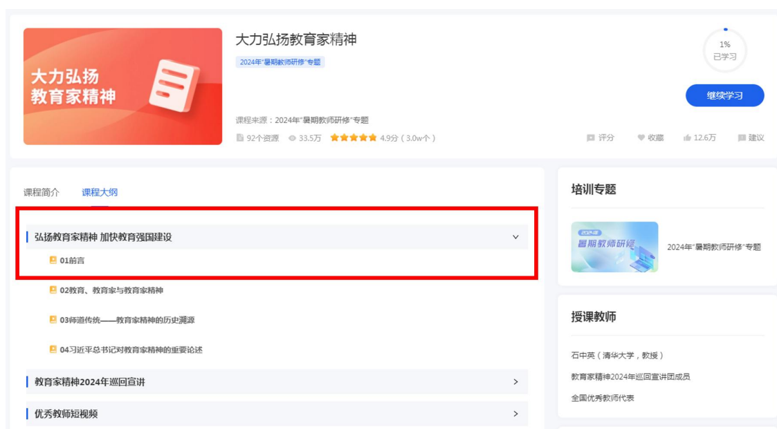
图 3 开始学习