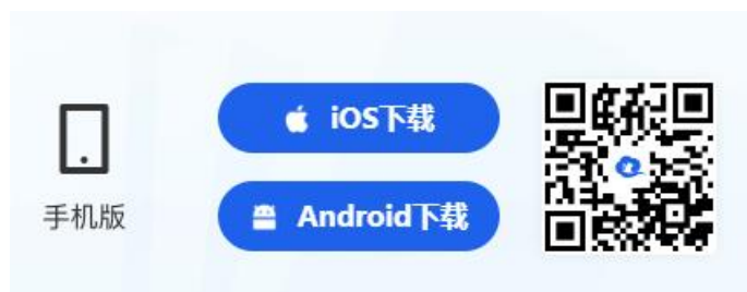
图4 “智慧中小学”APP二维码

在智慧中小学APP中完成注册（ 请选择教师身份 ）、登录。在“资源”的首页或推荐的轮播图中点击“2025年寒假教师研修”，进入专题页。点击报名后即可开始学习。