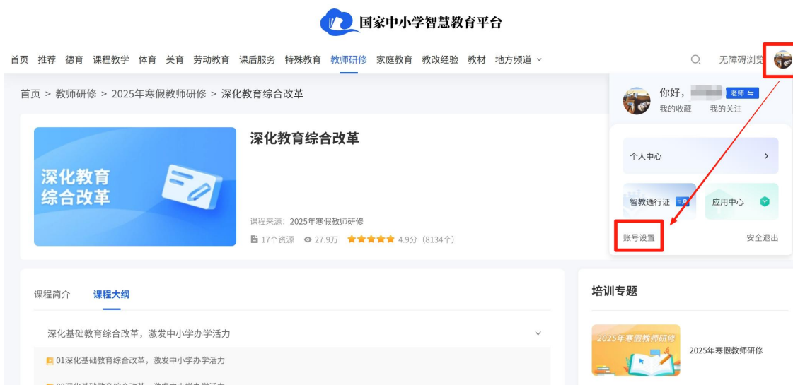
图 13 换绑手机号步骤 1