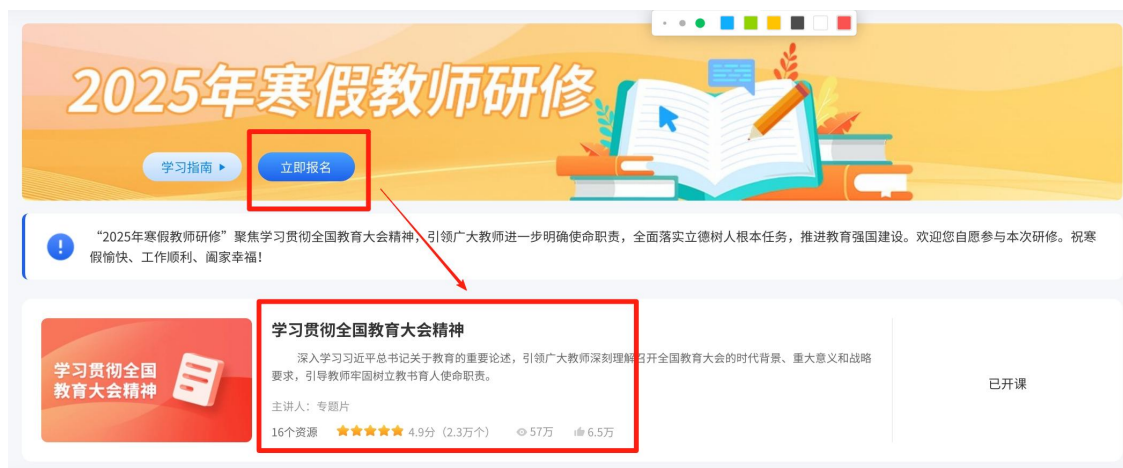
图 2 报名、进入课程详情页