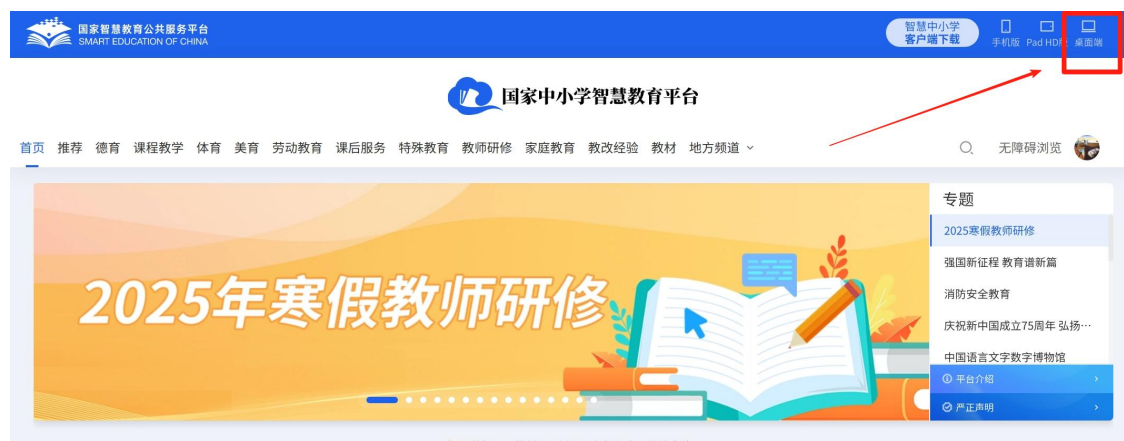
图 6 下载“桌面端”

访问国家中小学智慧教育平台 (basic.smartedu.cn)，点击右上角“桌面端”下载并安装软件。