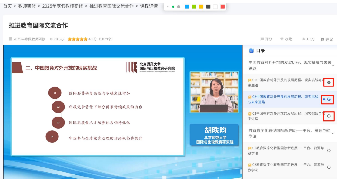
图 12 单个资源学习进度