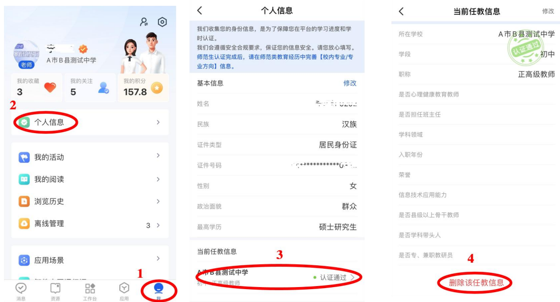
图 18 在 APP 从学校中移除