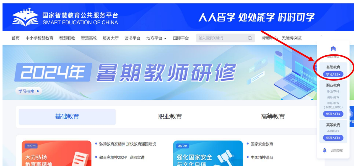
图 10 从公共服务平台专题页进入学习