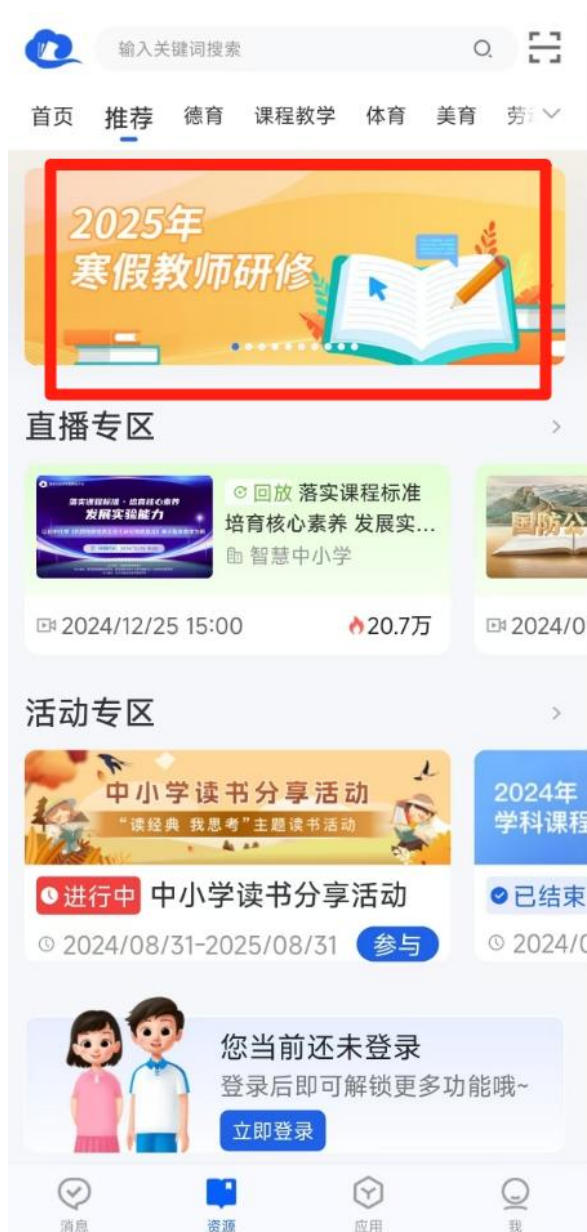
图5 “智慧中小学”APP进入专题

在智慧中小学APP中完成注册（ 请选择教师身份 ）、登录。在“资源”的首页或推荐的轮播图中点击“2025年寒假教师研修”，进入专题页。点击报名后即可开始学习。